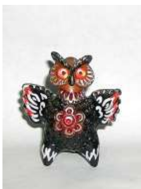
ПЛЁС XX век

— СМ. http://omene.ru/gallery/collections/svistulki/49 ИЛИ ЖЕ http://omene.ru/gallery/collections/svistulki/1.html И ТАКЖЕ http://omene.ru/gallery/collections/svistulki/59