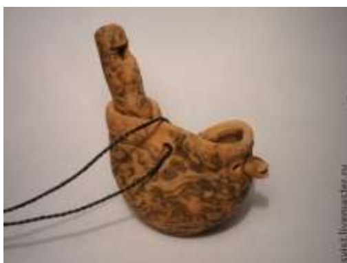
СОЛОВЕЙ /не РАЗБОЙНИК/ наше время

ЧУВИЛЬКА = ЧУВА (СОВА, СОВИЯ) = СОЛОПЕЛКА = СОЛОВЕЙ = СВИРЕЛЬ