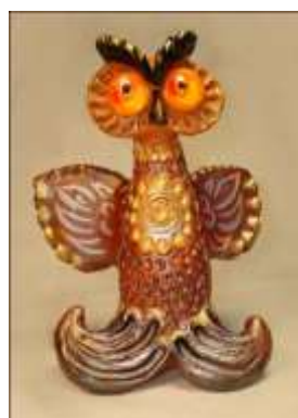
ПЛЁС XXI век