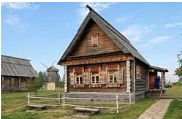
Крестьянский дом Владимирской губернии . 2-я пол. XIX в.