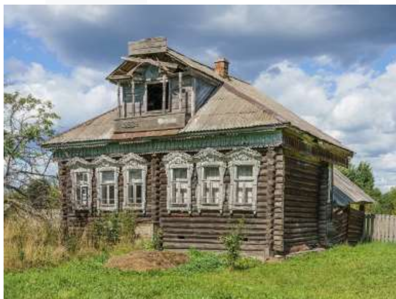
Русская изба в селе Мелёшино Палехского района Ивановской области.