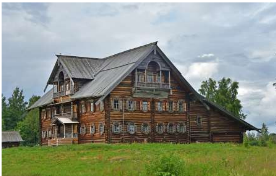
Дом Сергина из Мунозера (Карелия). Пример северного дома-комплекса 2-й пол. XIX в.