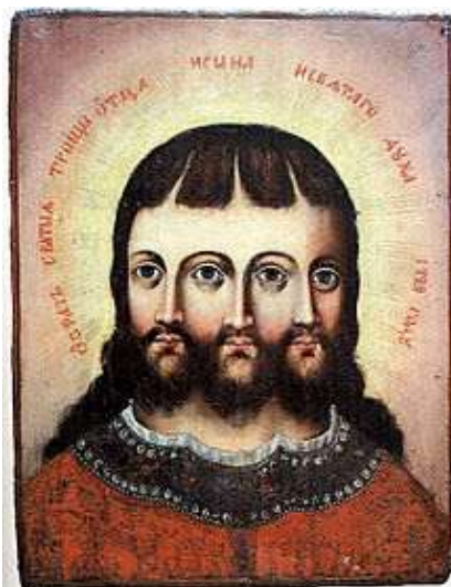
Икона: «Троица смес-о-ипостасная»: 1729

http://exeget.panikarolinka.ru/misc/smesoips.html https://commons.wikimedia.org/wiki/File:Троица_1729.jpg