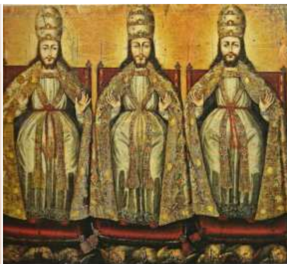
«Троица смес-о-ипостасная» да и «Троица-расколота»