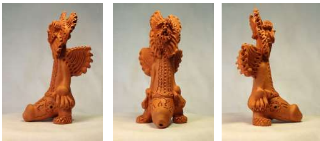
ЧУВИЛЕЦКИЙ/ЧЕВЫЛЕЦКИЙ ХЕРУВИМ = ХЕРМАСТА = ХЕРМАН (частная коллекция, millennium 1999/2000 гг.)

Нельзя будет не заметить и чернолощённую (и, расписную!!!) керамическую утварь, посуду (типа: ЧУВИЛЬ – нашим РУССКОЯЗЫЧНЫМ ВАХЛАКАМ от наших ПО ФЕНИ БОТАЮЩИХ ЧУВАКОВ из ПЛЁСА-НА-ВОЛГЕ, в Ивановской области... ВАША МАТЬ, ВЕЛИКАЯ РОССИЯ: по-над долгими плесами чевылецкими ):