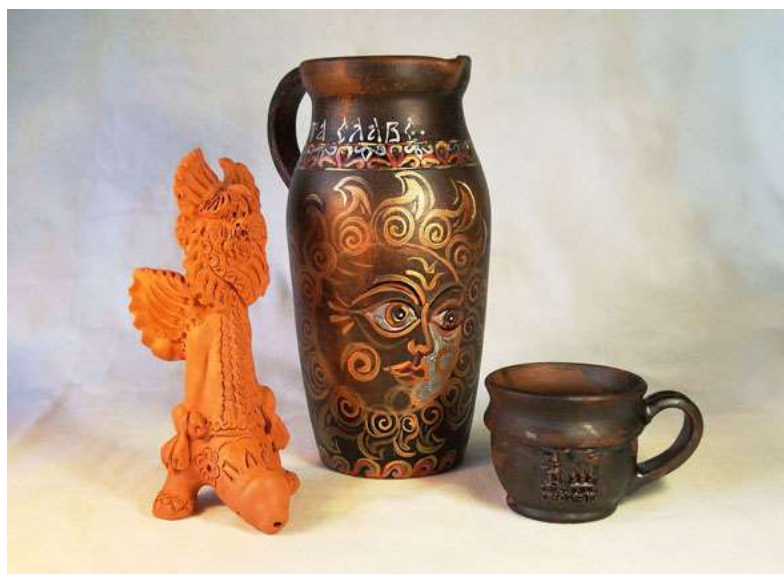
ЧЕРНОЛОЩЁНАЯ И РАСПИСНАЯ КЕРАМИКА /от Золотарёвых/

Нельзя будет не заметить и чернолощённую (и, расписную!!!) керамическую утварь, посуду (типа: ЧУВИЛЬ – нашим РУССКОЯЗЫЧНЫМ ВАХЛАКАМ от наших ПО ФЕНИ БОТАЮЩИХ ЧУВАКОВ из ПЛЁСА-НА-ВОЛГЕ, в Ивановской области... ВАША МАТЬ, ВЕЛИКАЯ РОССИЯ: по-над долгими плесами чевылецкими ):